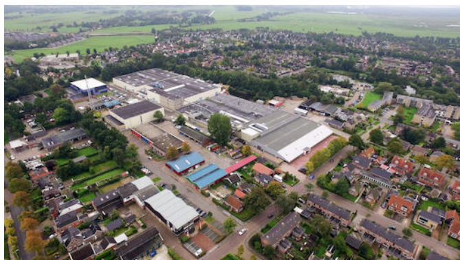
Enitor Primo Buitenpost

Voor meer informatie bezoek onze website www.enitor.com