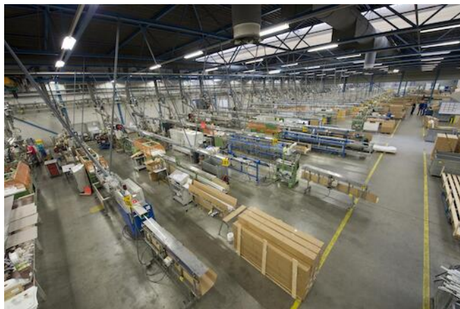
Enitor Primo Productiehal