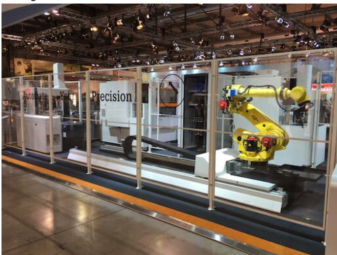
System 3R linear cell with several applications

Werkplaats industrie 4.0. Example of Fanuc robot on rail with milling machine, EDM machine and CMM