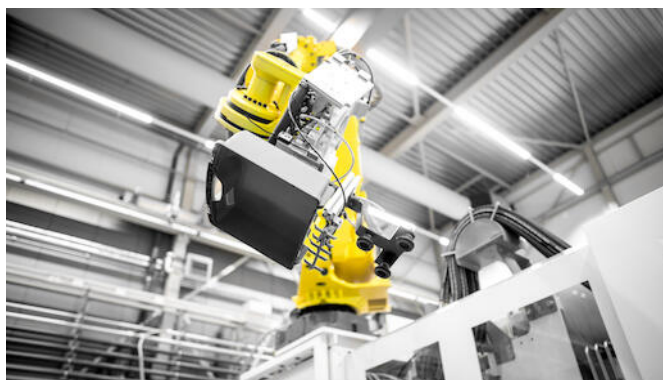
GL Plastics is een solide en betrouwbare partner voor het spuitgieten van uw kunststof producten

Voor nieuwbouwmatrijsen maken wij gebruik van strategische partners (wereldwijd).