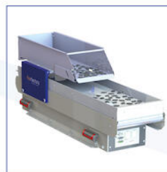
FLEXFACTORY FLEXIBELE TOEVOERSYSTEMEN