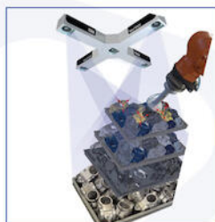
ISRA 3D VISIE + BINPICKING