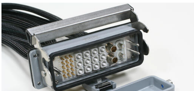
Hybride kabel met power, fiberoptics, ethernet en coax