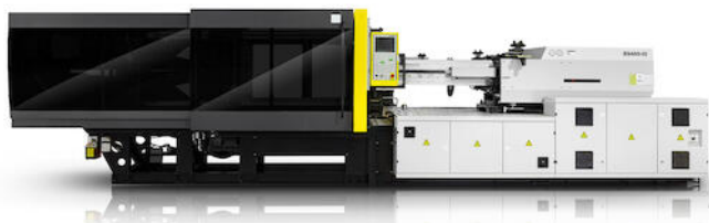
Borche spuitgietmachines met servo-aandrijving

OBINION is leverancier van een uitgebreid scala aan machines, apparatuur, services en diensten aan de kunststofverwerkende en recycle industrie .