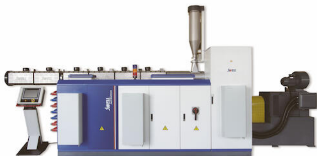
Jwell extrusie lijnen

Verouderde productiemethoden, machines en apparatuur staan een optimaal productieproces in de weg. Veelvoorkomende handelingen kunnen worden geautomatiseerd, wat al snel resultaten in effectiviteit, kwaliteit en kosten biedt.