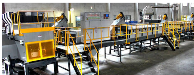
GeNox recycle lijnen voor kunststof, rubber, PMD en metalen

OBINION levert meer dan producten. Ook training en certificering zijn een belangrijk deel van onze dienstverlening. Optimalisatie van productieprocessen kan alleen worden gerealiseerd als werkmethoden, vaardigheden en apparatuur zorgvuldig zijn geïntegreerd.