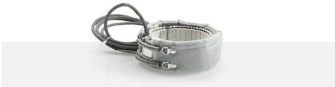
Isolatie voor verwarmingselementen