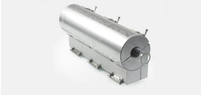
Verwarm- en koelcombinatie voor extrusieproces

Stufa levert verwarmingselementen van Ihne & Tesch GmbH