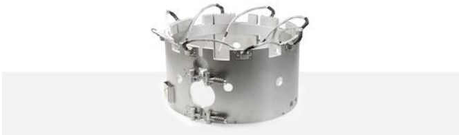
Aluminium verwarmingselement met ingebouwde zones