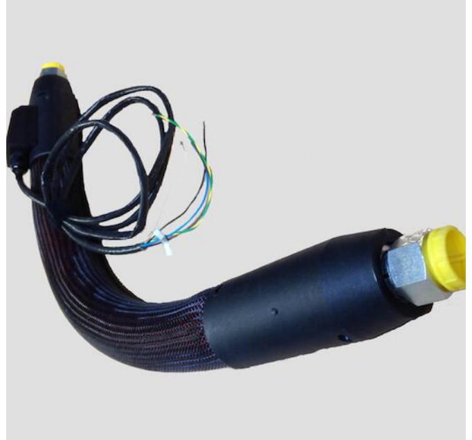
HILLESHEIM Verwarmde slang