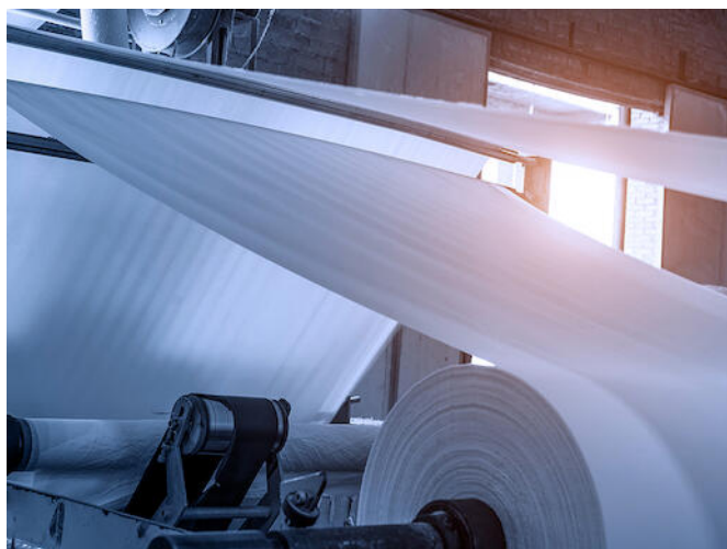
Verpakking en palletisering hotmelt systemen

Heeft u een lijmprobleem? Bodo Möller Chemie zoekt voor u de oplossing op maat van uw toepassing en productieproces.