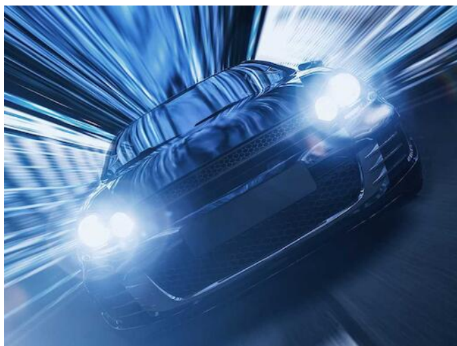
Structurele en elastische lijmsystemen voor metaal- en kunststofverlijmingen